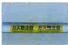
(架空配管部への標示)