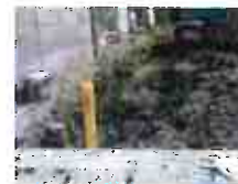
(ガス管切断後の管末標示杭)