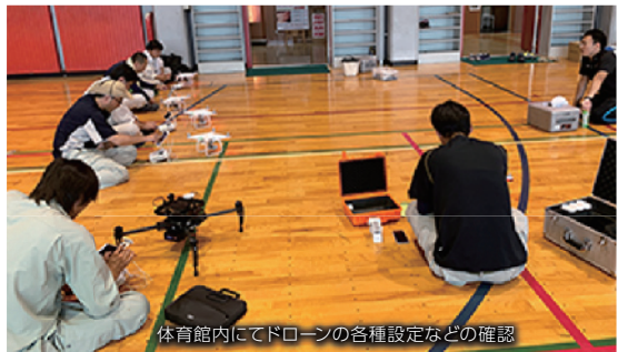
体育館内にてドローンの各種設定などの確認