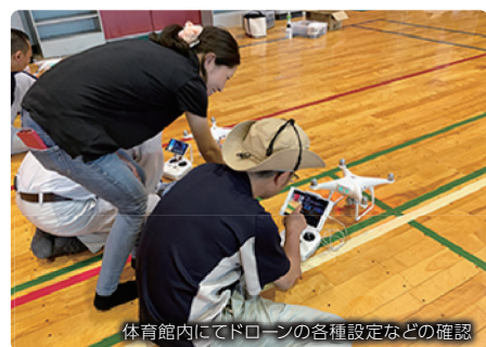
体育館内にてドローンの各種設定などの確認