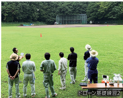
ドローン基礎練習2