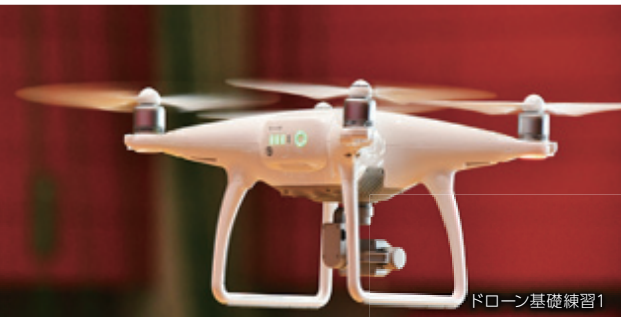
ドローン基礎練習1