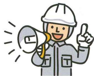
登録ストックヤードへの搬出を予定している大手ゼネコン会社

熱海における土石流災害や盛土規制法の制定などを受けて、我が社でも建設発生土の有効利用、適切な搬出先管理に取り組んでいるところです。令和6年6月以降は、元請業者が最終搬出先を確認することが必要になりますが、 ストックヤードを経由する場合、最終搬出先までの追跡が困難になることが想定されるので、登録ストックヤード事業者を活用する予定です 。発注者からもコンプライアンス（法令遵守）を厳しく求められることもあり、取引のあるストックヤード事業者には、早期の登録を働きかけています。