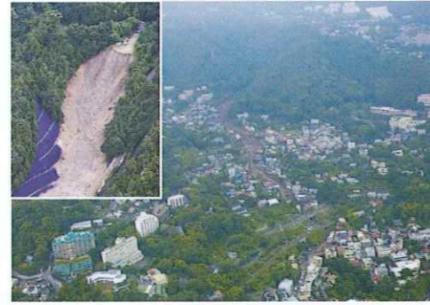
R3.7 静岡県熱海市 死者28名、住宅被害98棟

つまり、登録ストックヤード運営事業者の皆様は、建設発生土の適切な利用・処分に向けた枠組みの一翼を担う主体となります。